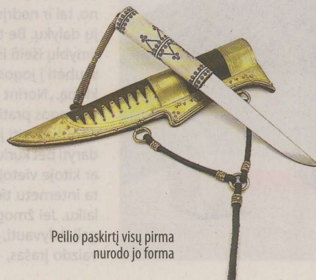
Peilio paskirtį visų pirma nurodo jo forma